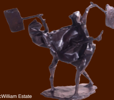
Sculpture © F E McWilliam Estate

Sociálne a politické nepokoje zostávali trvalým faktorom. Od konca 60. rokov často prebiehali násilné konflikty a v dôsledku toho sa mnohí ľudia odsťahovali z Belfastu. Vybudovali sa pre nich nové sídliská – Flying Horse v Downpatricku a Kilcooley v Bangore. Od 90. rokov prišli do grófstva Down mnohí noví prisťahovalci z celej Európy a iných častí sveta.